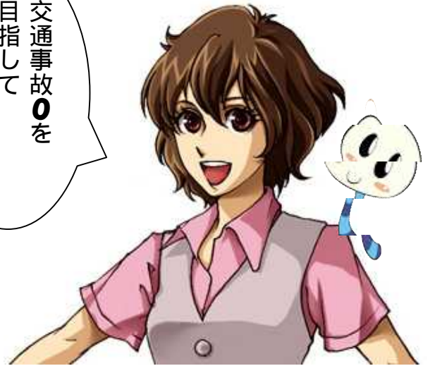
看板娘 うらちゃん&サブキャラ いもこちゃん