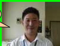
野田インストラクター