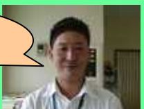
野田インストラクター