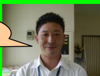
野田インストラクター