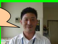
野田インストラクター