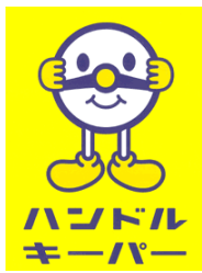
ハンドルキーパー