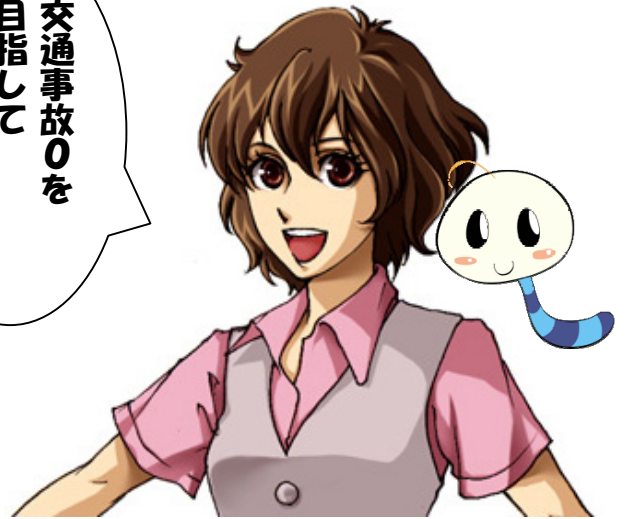
看板娘 うらちゅちゃん&サブキャラ いもちゅちゃん