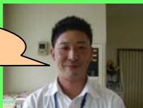
野田インストラクター