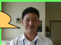
野田インストラクター