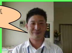
野田インストラクター