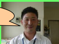
野田インストラクター