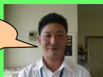
野田インストラクター