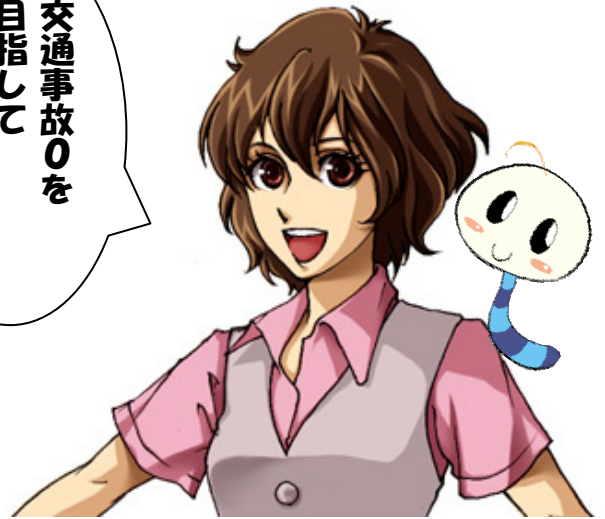
看板娘 うらちゅちゃん&サブキャラ いもちゅちゃん