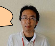
柳町インストラクター