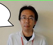
柳町インストラクター