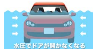
水圧でドアが開かなくなる

冠水した道路の水位が深い場合や、湖などに転落したときは、車両の前方に重いエンジンが搭載されている乗用車では、前部が最初に沈みこみ傾姿勢となります。万一、こうした状況に遭遇しても慌てずに、まずシートベルトを外します。ウインドウガラスが水面より高い位置にある状態なら、ウインドウを開けてクルマのルーフ(天井)に上るようにして脱出します。ところが、パワーウインドウの場合は水による電気系統のトラブルやガラスにかかる水圧で開かなくなってしまうこともあります。