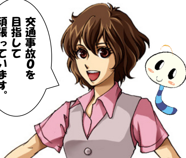
看板娘 うららちゃん&サブキャラ いもこちゃん