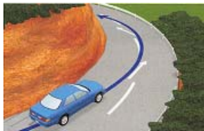
右側通行の標示箇所