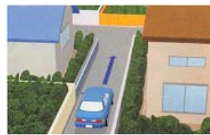
狭道を通行するとき

前述の通り車は左側通行ですが、次の場合は右側部分にはみ出して通行する事が出来ます。しかし、 一方通行の道路 を通行する場合は 対向車との接触等の危険が考えられるので出るだけのみ出し方が少なくなるように しましょう。