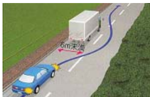
追い越しをするとき