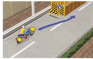
障害物を避けるとき