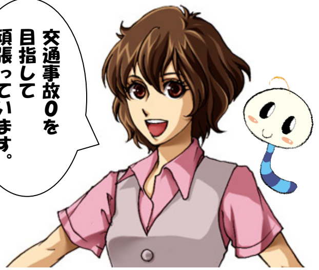
看板娘 うらちゃん&サブキャラ いもこちゃん